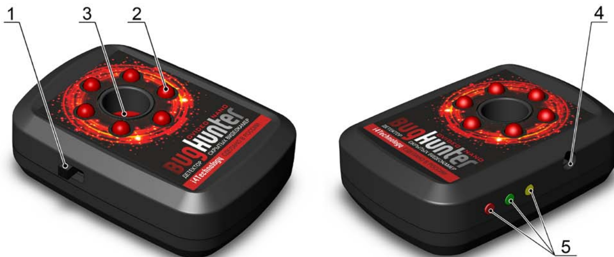
Рисунок 2 – расположение основных частей изделия

1.3.2 Расположение основных частей изделия представлено на рисунке 2.