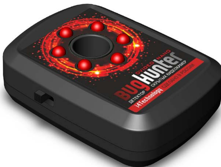
Рисунок 1 – внешний вид изделия

1.2.1 Внешний вид изделия представлен на рисунке 1